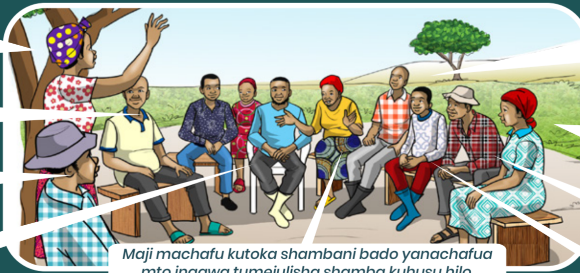
Maji machafu kutoka shambani bado yanachafua mto ingawa tumejulisha shamba kuhusu hilo.

Kwa nini wakufunzi wote wa kikundi wanatoka kijiji kimoja? Hakuna mtu mwingine aliyepewa nafasi hiyo.